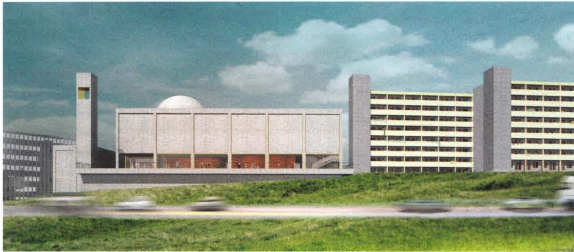
Bild av Rinkebymoskén sedd från Järvafältet. Ritning: Spridd arkitekter.

jonprogrammets prototyp för centrum kanske har hittat en särskilt bidragande motpart i form av dessa nya moskéer.