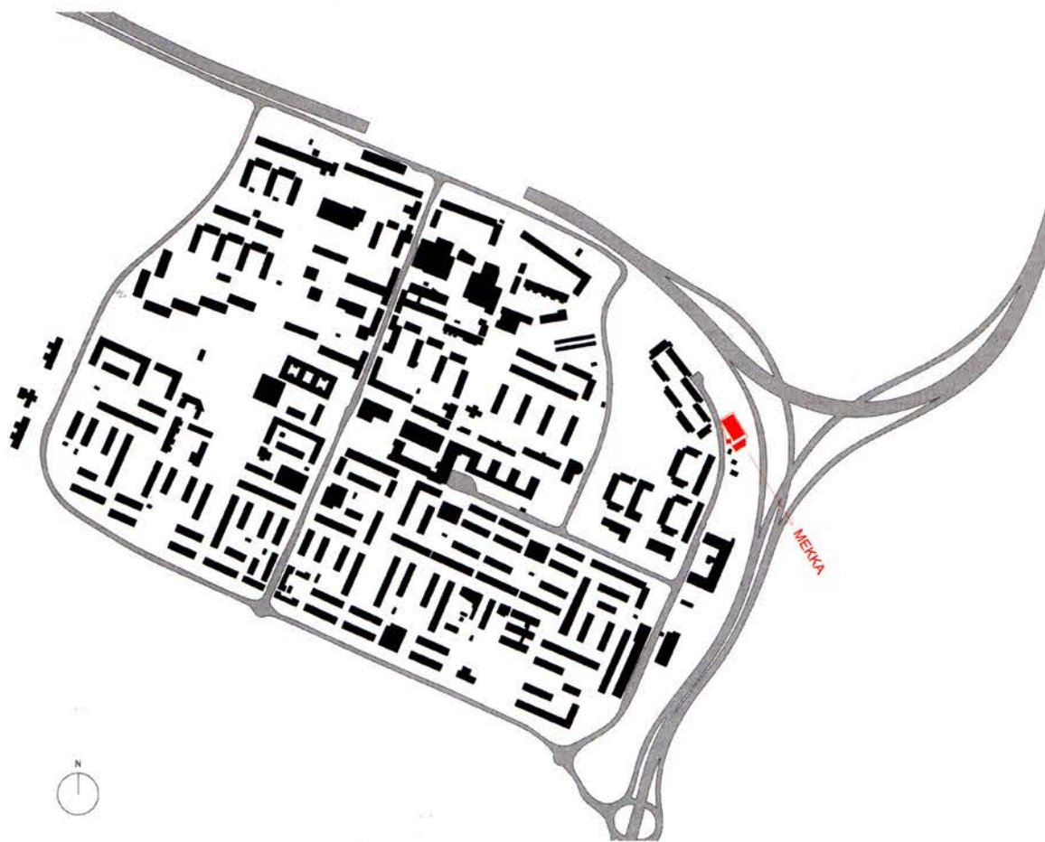
Situationsplan Rinkeby. Ritning: Spridd arkitekter.

dåtidens kyrka kan sägas representera flera liknande värden. Som sociala centra utgör de en motvikt till konsumtionshetsen i andra »centrum« som allt mer har kommit att likna köpcentrum. Det sociala utbudet återspeglar istället konservativa värderingar hos de religiösa grupper som står bakom dem. Den symboliska och arkitektoniskt ikoniska närvaron av de nya verken – i kombination med den höga kostna-